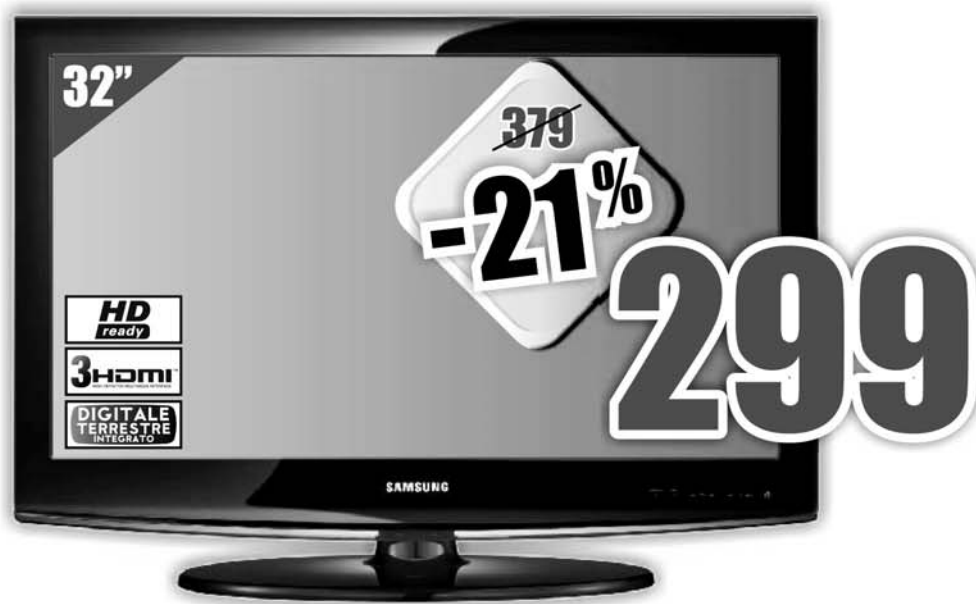
SAMSUNG - LE32C450 Tv LCD 32", 16:9 formato cinema, HD READY, decoder digitale terrestre integrato, audio stereo, ConnectShare Movie (USB Video), 3 HDMI, slot CI+