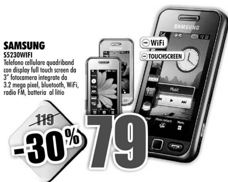
SAMSUNG S5230WIFI Telefono cellulare quadriband con display full touch screen da 3" fotocamera integrate da 3.2 mega pixel, bluetooth, WiFi, radio FM, batteria al litio