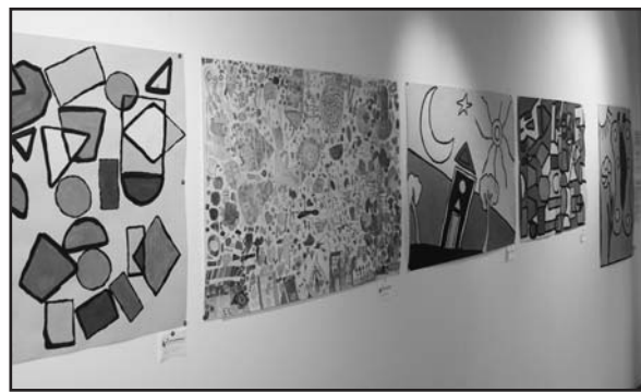
Una "esplosione di colore".

La mostra rimarrà aperta fino al 5 giugno con i seguenti orari: dal venerdì alla domenica dalle ore 10 alle 12 e dalle ore 16 alle ore 19.