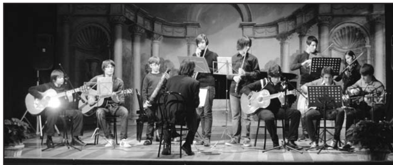
Una esibizione al Teatro Sociale.