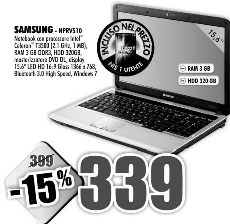
SAMSUNG - NPRV510 Notebook con processore Intel® Celeron® T3500 (2.1 GHz, 1 MB), RAM 3 GB DDR3, HDD 320GB, masterizzatore DVD DL, display 15.6" LED HD 16:9 Gloss 1366 x 768, Bluetooth 3.0 High Speed, Windows 7

I prezzi esposti sono comprensivi di Ico-contributo RAEE e validi nei punti vendita che partecipano all'iniziativa. Le offerte sono valide dal 21 maggio al 6 giugno 2011, salvo errori ed omissioni. Le foto sono a scopo puramente indicativo.