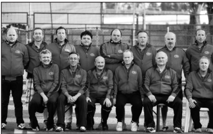
Il direttivo del nuovo Centro Sportivo Oratorio Borgosotto.

Il torneo, ricco di premi, grazie anche ai numerosi sponsor che anche per quest'anno sono apparsi sull'elegante libretto, ricco di documentazione fotografica e delle indicazioni tecniche per chi vuole seguire le varie fasi del torneo. Si gioca da lunedì 30 maggio nelle serate appunto di lunedì, mercoledì e venerdì a partire dalle ore 20,30. Le fi-