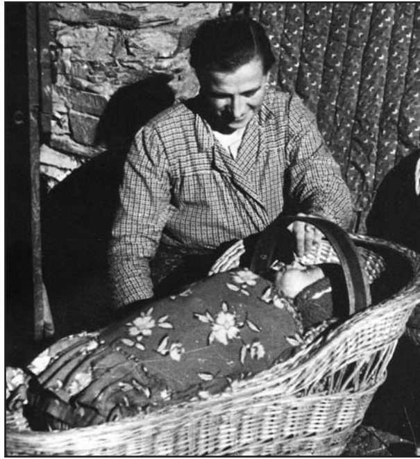
Armonia d'amore, prime conversazioni (particolare di una foto di Fausto Schena, da "Il peso della gerla", Giornale di Brescia, 1991).

tri presso l'ulivo del fratellino Francesco, già frondoso e robusto, tanto da poterlo sostenere se vi si arrampica. Mi scopro, mentre gli parlo, di usare le espressioni tipiche di mia madre, quando teneva discorsi matti d'amore ai nipotini, o tesseva con loro dialoghi buffi e inverosimili, sull'onda della sua fervida fantasia e della sua singolare capacità di imitazione.