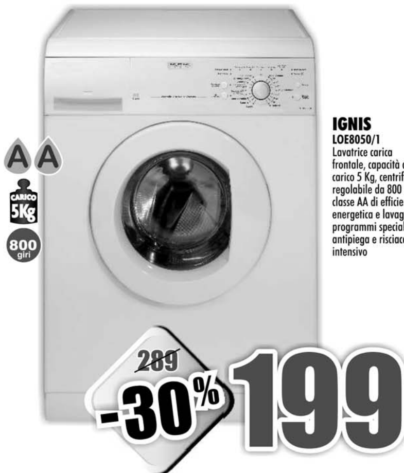
IGNIS LOE8050/1 Lavatrice carica frontale, capacità di carico 5 Kg, centrifuga regolabile da 800 giri, classe AA di efficienza energetica e lavaggio, programmi speciali antipegna e risciacquo intensivo