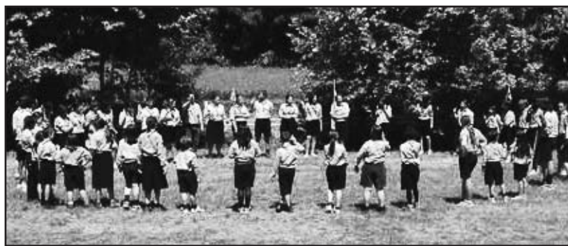
Una immagine di repertorio di un campo scout.

D omenica 29 maggio si celebra a Montichiari il sessantesimo della nascita del Gruppo Scout di Montichiari. "In un periodo storico dove l'emergenza educativa è stata messa al centro dell'attenzione anche dalla Chiesa Cattolica Italiana nei suoi orientamenti pastorali dell'Episcopato per il decennio 2010-2020, lo scautismo continua con convinzione a proporre il suo metodo educativo, a volte criticato o non capito, ma sempre più riconosciuto ed apprezzato. Nonostante che le difficoltà non manchino, siamo riusciti, grazie alla passione educativa e allo spirito di servizio, a spegnere sessanta candeline! Vorrei